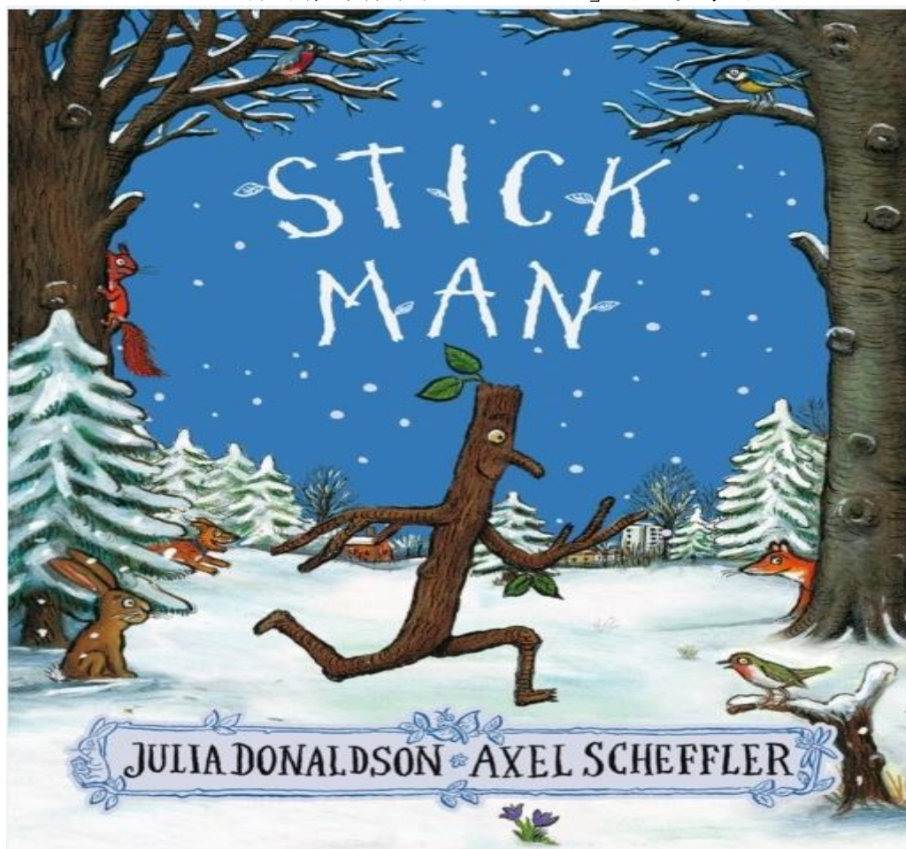
P.2 英文科圖書閱讀課本「Stick Man」封面參考圖片

註：以上二級英文科圖書閱讀課本必須購買，如學生有上述環保(舊)圖書課本(請核對出版社、作者及版次等資料正確無誤)，可選擇不購買，並於繳費時選擇正確的金額付費。