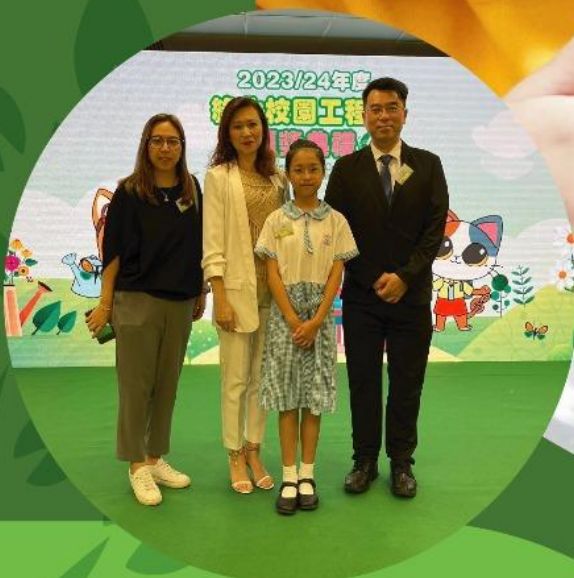
二零二三/二零二四年綠化校園工程獎 大園圃種植(小學組)冠軍